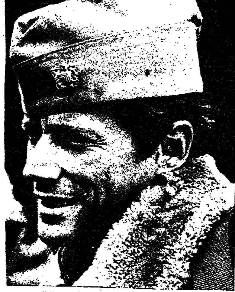
الممثل بيتر شتراوسي في دور «جو كدي» - التلفزيون الإسرائيلي - السبت - العاشرة وخمسة دقائق

الجمعة نشرة اخبارية كل ساعتين من الساعة مباحة